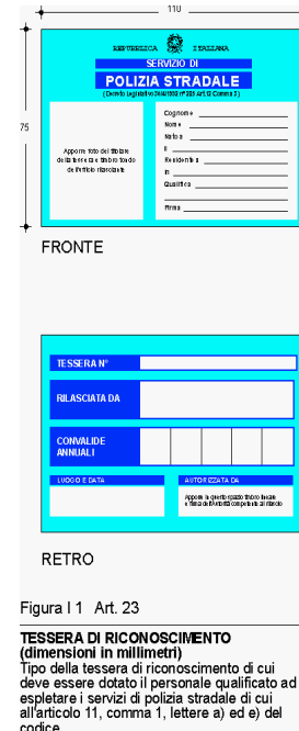
Figura I.1 Art. 23

Comma 5: Al titolare della tessera di riconoscimento di cui al comma 4 e' consentita la libera circolazione sui trasporti pubblici urbani e sui trasporti automobilistici di linea nell'ambito del territorio di competenza della amministrazione di appartenenza.