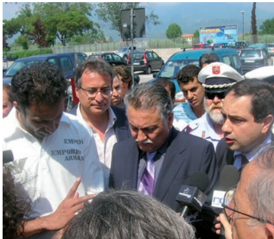
L'Ambasciatore del Marocco