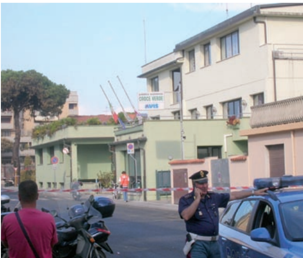
La sede della Croce Verde gravemente distrutta dall'esplosione