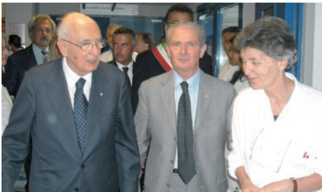
Il Presidente della Repubblica visita i feriti ricoverati all'Ospedale Versilia