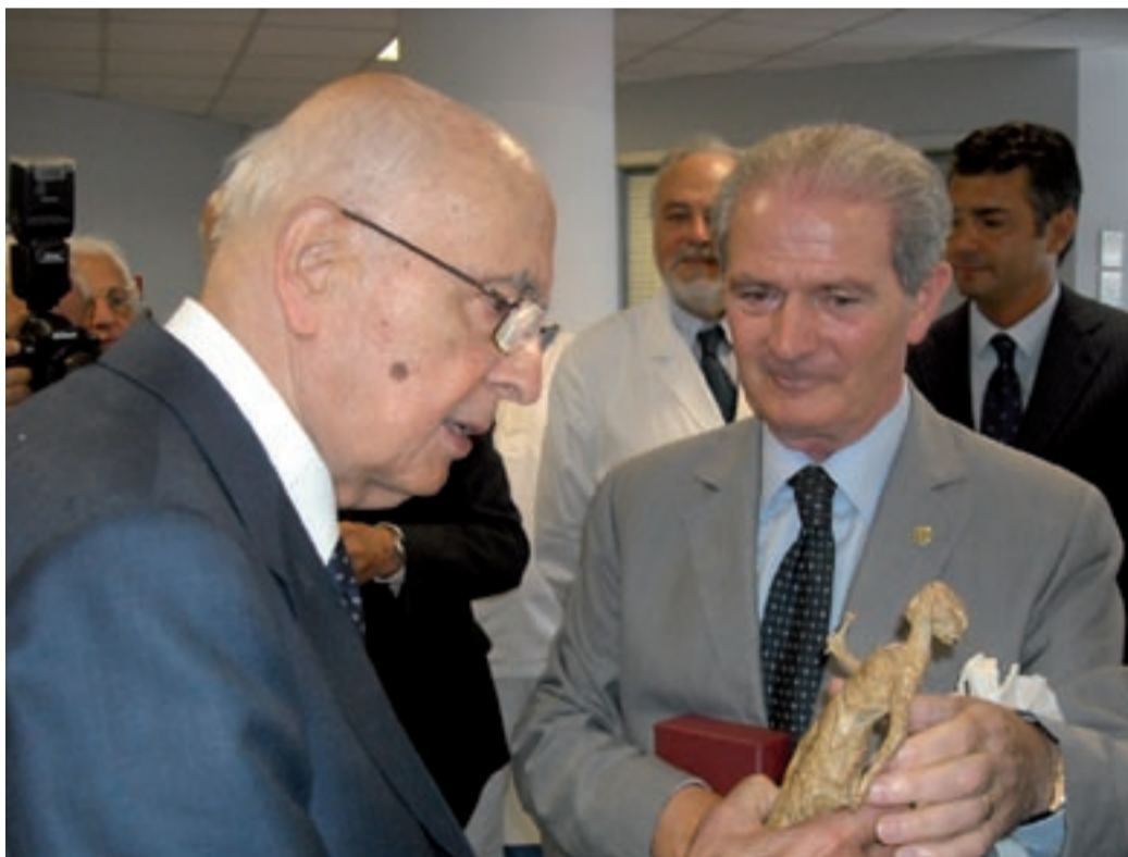
Il Presidente della Repubblica riceve il modellino della Statua di Romano Cosci installata all'ingresso del Versilia