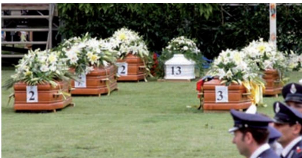
Un immagine dei funerali di Stato celebrati allo Stadio dei Pini