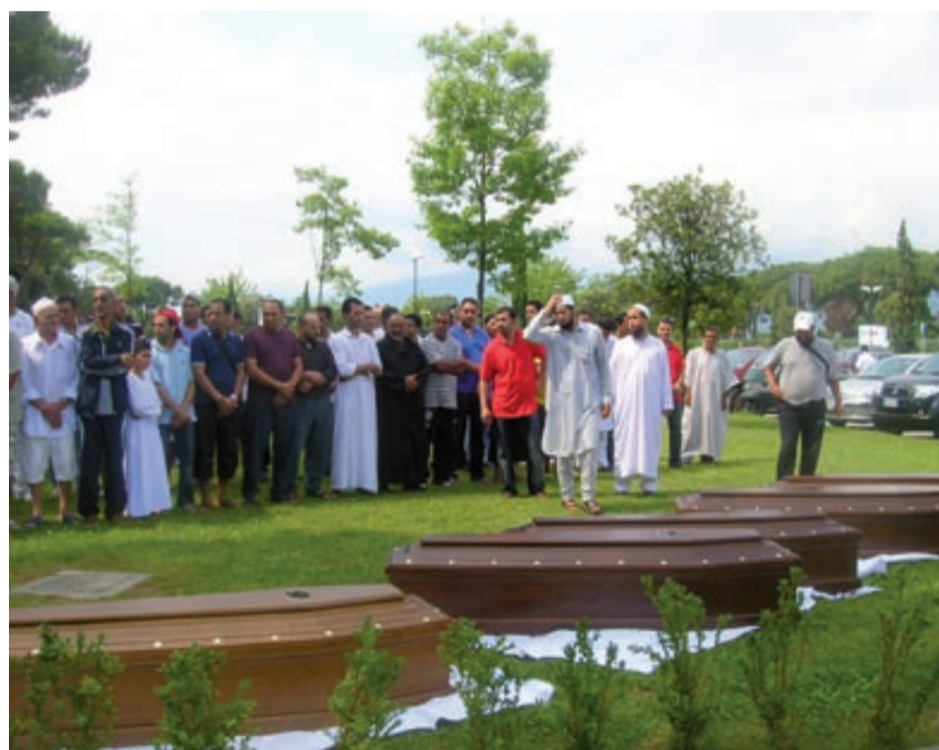
La cerimonia funebre, nel prato dell'Ospedale Versilia, della comunità musulmana