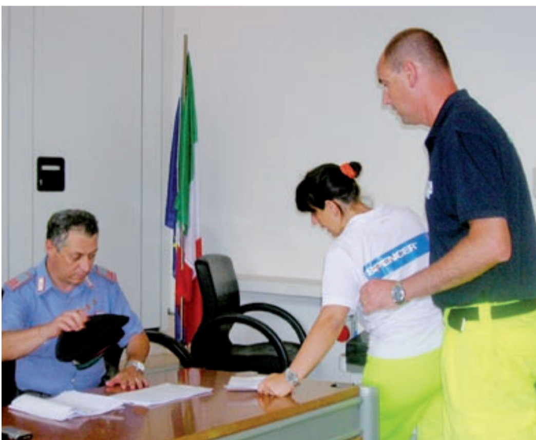
Un tavolo della Protezione Civile nel Palazzo Comunale di Viareggio